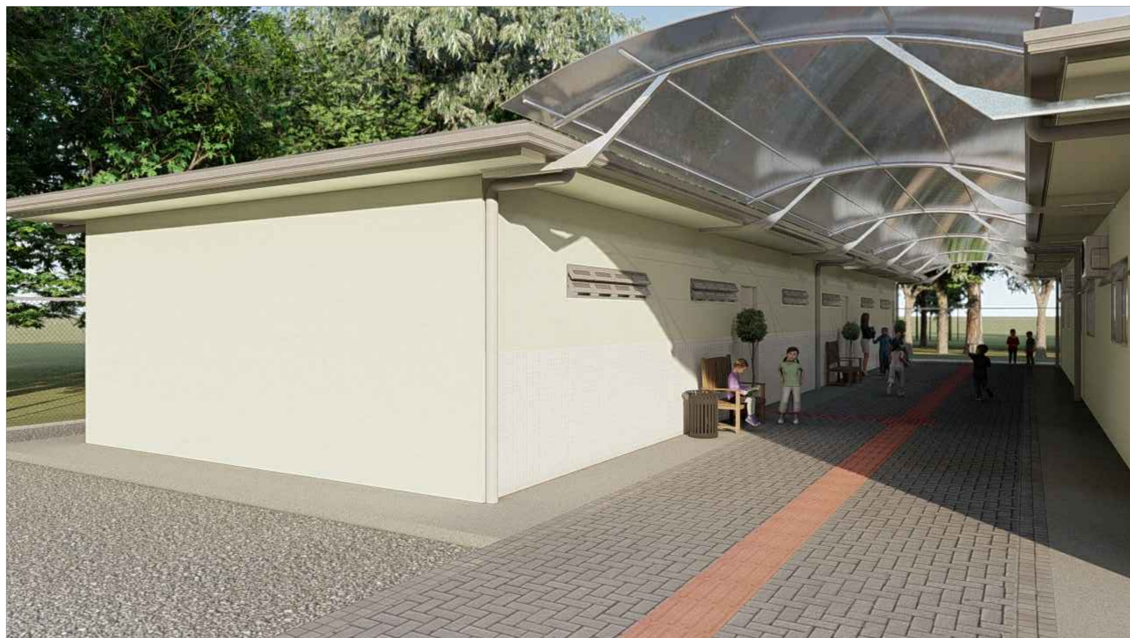
VISTA 01 ESC.5/ESC.