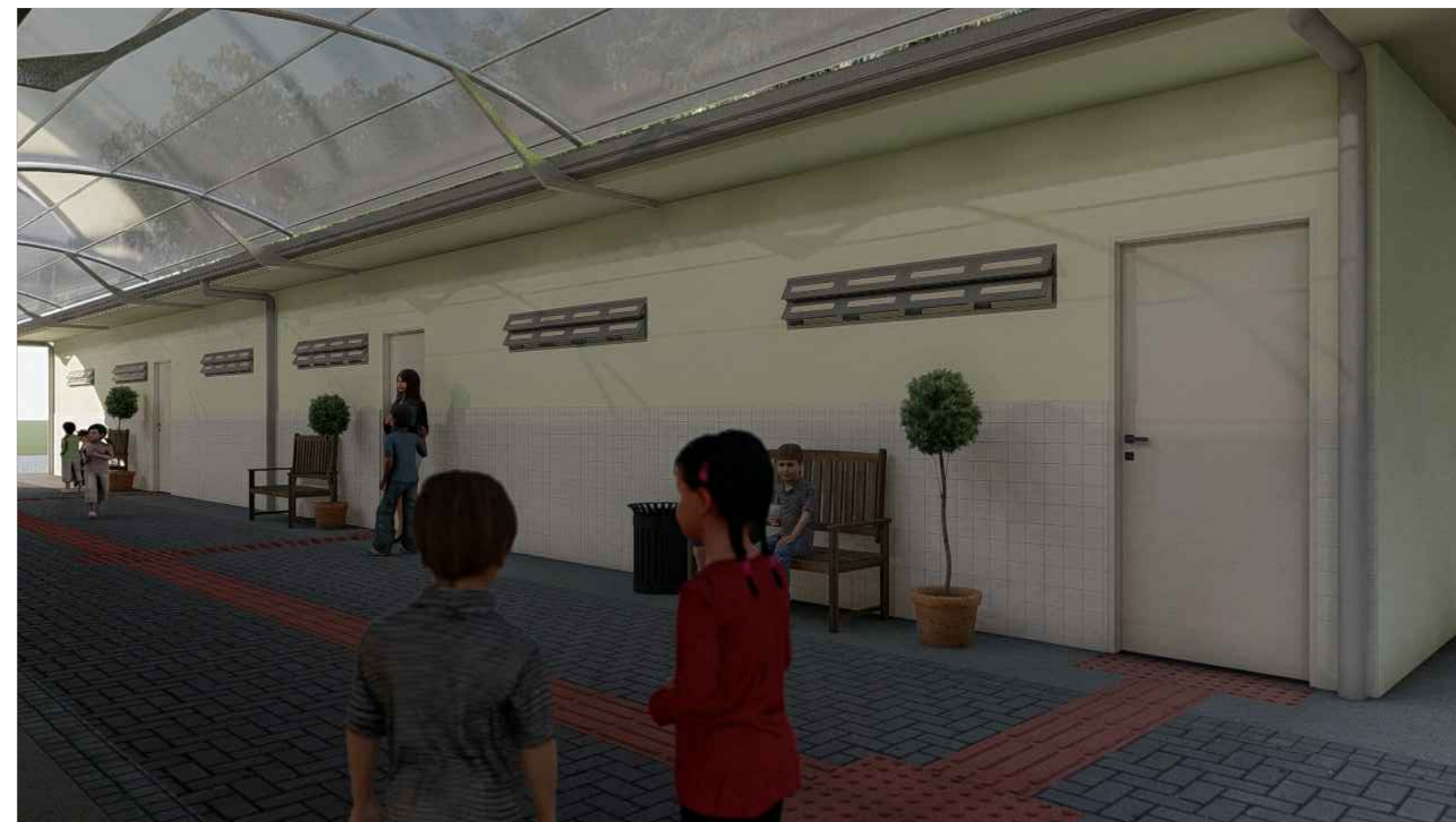
VISTA 02 ESC.5/ESC.