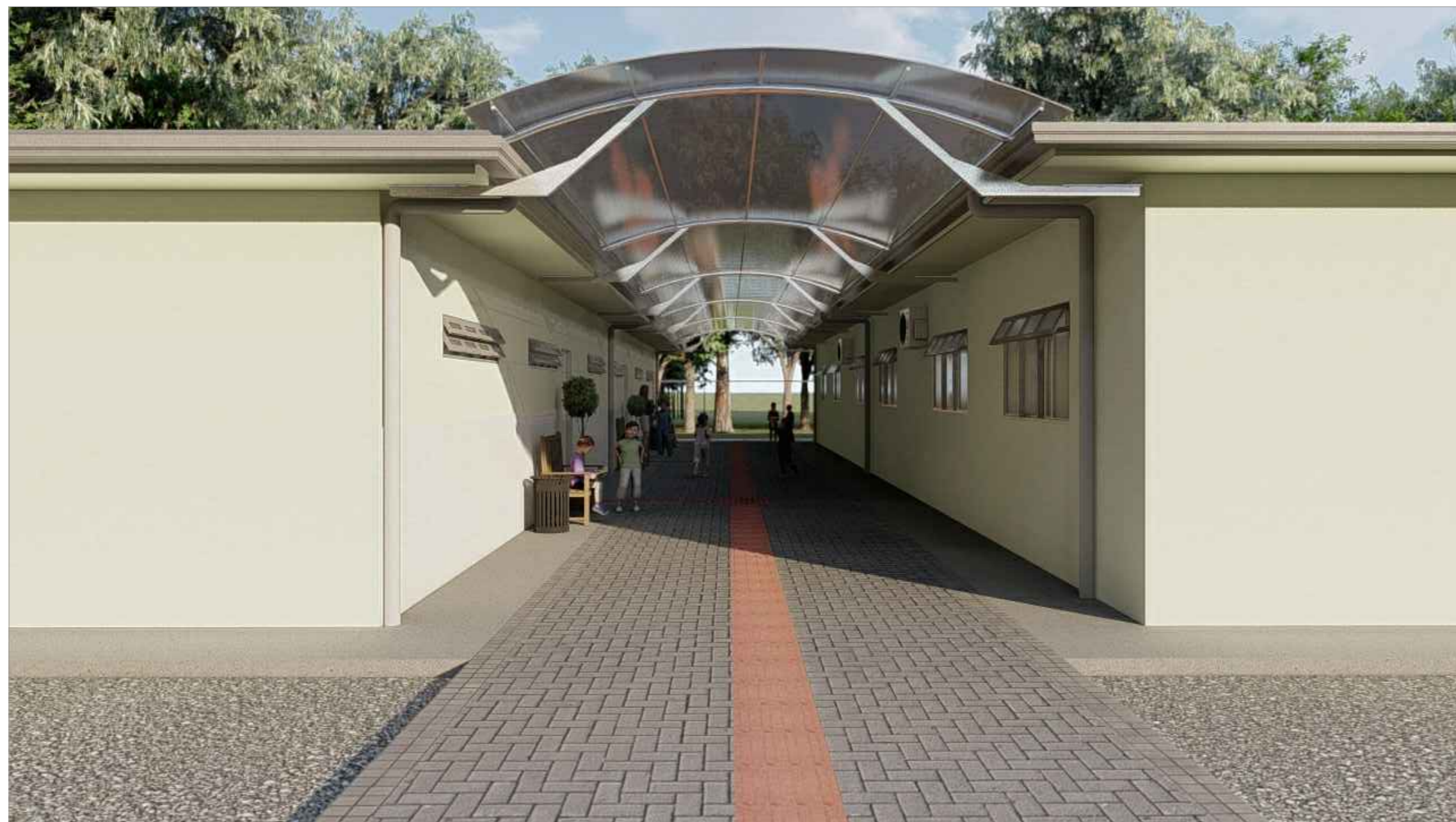
VISTA 03 ESC.5/ESC.